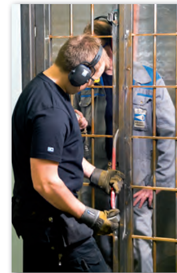
Manuella angrepp – SSF Provning har lång erfarenhet av manuella angreppsprovningar. Vid dessa provningar är det tid och verktyg enligt produkt standarden samt provarens erfarenhet som ger resultat.

Vi kan hjälpa dig och ditt företag med undersökningar, utvecklingsprovningar, delprovningar eller fullständiga provningar. Ring oss så berättar vi mer, tel 08-783 75 33.